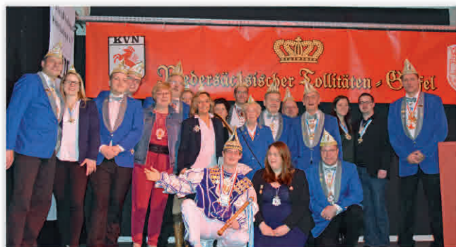
Funkenartillerie Blau-Weiss, Batterie Süd, Hannover-Döhren e.V.

Mit über 400 Gästen ist „Döhren Alaaf“ seit Jahren eine der beliebtesten Karnevalssitzung in und um Hannover. Für einen schönen und unvergesslichen Abend werden über 100 aktive Blau-Weisse für ein buntes Programm aus Musik, Tanz und Bütt sorgen. Die begehrten Eintrittskarten sind bei Schönes & Feines, Ziegelstr. 15, Döhren, Tel. (0511) 866 98 55 zum Preis von 22,- € erhältlich. Aber auch die „Kleinen“ kommen nicht zu kurz: Am 3. März findet um 15.11 Uhr im Hangar No. 5 wie-