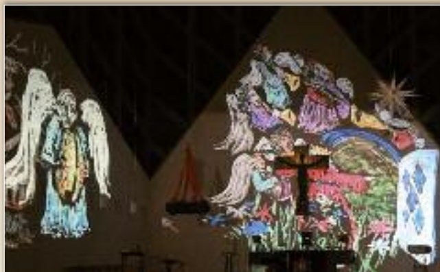
verwandelter Innenraum der Auferstehungskirche

An diesem ersten Adventswochenende war es nun endlich so weit: Döhrens Auferstehungskirche leuchtete. Gemeindeglieder und Besucher, die sich ihrem Kirchengebäude näherten, staunten nicht schlecht. Vor Ihren Augen verwandelten sich Kirche und Turm in eine belebte Lichtinstallation. Fremde Welten entstanden auf den vertrauten Gebäuden. Besucher konnten live miterleben, wie die zunächst schwarz-weißen Lichtbilder sich farbig füllten,