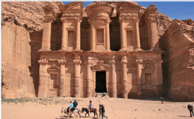
Das Kloster Ed Deir

hen während der Sprechzeit des Seniorenbüros (Mo. 11.00 – 13.00 Uhr) und zu Zeiten, wo Gruppen dort ihre Treffen haben. Diese sind im Programm zu finden. Für den Vortrag ist eine Anmeldung erforderlich. (In den Sprechzeiten, Tel. 0511/16848785 oder E-Mail an info@seniorenbuero-kbwrode.de)