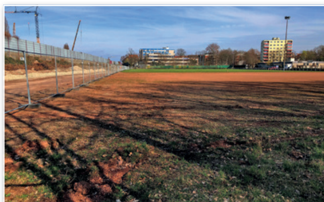
Die Stadt soll den Vereinen auf der Bezirkssportanlage Döhren bei der Beseitigung von Protestlern verursachten Schäden helfen, forderten CDU und SPD in einem gemeinsamen Antrag

„Der Stadtbezirksrat Döhren-Wülfel fordert Rat und Verwaltung auf, den Neubau bzw. die Sanierung des Freizeitheims Döhren mit integrierten Bürgeramt, Bücherei und Jugendzentrum weiterhin mit höchster Priorität zu verfolgen“, heißt es in dem SPD-Text. Hintergrund: Die Stadtverwaltung hat vorgeschlagen, den Neubau des Freizeitheimes Ricklingen zu „priorisieren“ und alle Pläne für Döhren zu verschieben. Auch sollen an der Stadtteilbücherei