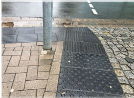
Noppen oder Rillen sorgen an vielen Stellen der Stadt für mehr Sicherheit für Sehbehinderte. Das soll zukünftig auch in Mittelfeld so sein.

Der Fußgängerüberweg am Brunnentreff, Höhe Grünberger Weg über die Straße „Am Mittelfeld“ ist für sehbehinderte Menschen gefährlich. „Sehbehinderte und Blinde können derzeit nicht erkennen, wo genau der Überweg von und zum Brunnentreff (und damit zur Stadtbahnhaltestelle) ist“, heißt es in einem Antrag, den die SPD zusammen mit der CDU und den Grünen in die Aprilsitzung des Stadtbezirksrates Döhren-Wülfel einbrachte.